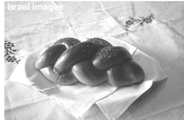
עריכה : ורדה שביט, אמנון ריבק